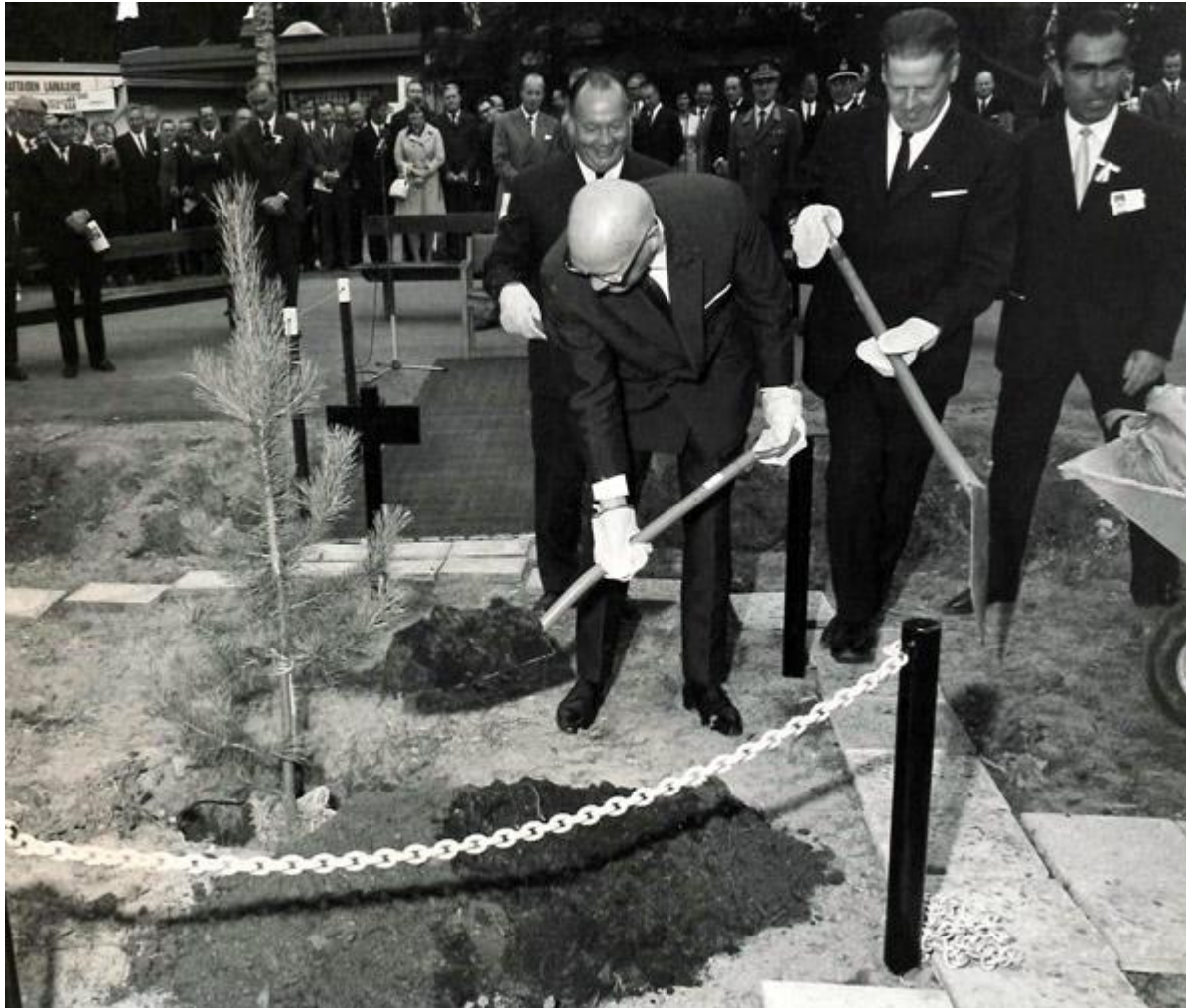
Ensimmäiset asuntomessut Tuusulassa 1970