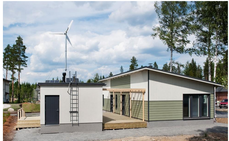
Lähivakuutus & Teijo-talot