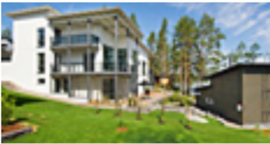
Kohde 35: Helminauha 10, LämpöPlus Oy paritalo, 208 m 2 / 93,5 m 2 ja 396 m 2