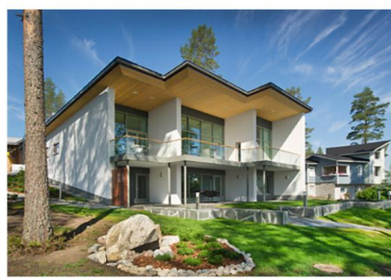
Kohde 29: Helminauha 18 Villa Valo Lammi Kivitalot, 296 m 2 ja 377 m 2