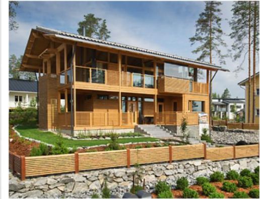
Kohde 28: Helminauha 11, Aamunsäde, Pohjolan Design-Talo Oy, 152 m 2 ja 178 m 2