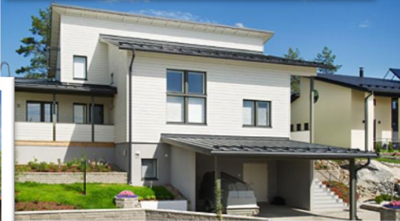
Kohde 8: Painikuja 7/ Kastelli Plaza 169, Kastelli-Talot Oy, 169 m 2 ja 218 m 2