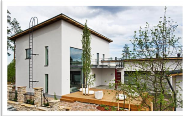
Kohde 16: Simpukankatu 6 / Italia-talo/ GATTO-keittiöt, Kuopion Talojazz Oy, 149 m 2 ja 197 m 2