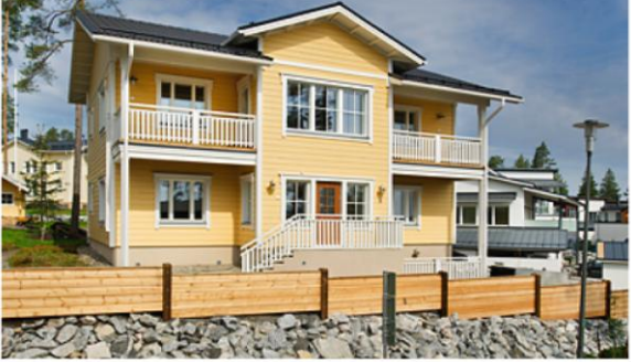
Kohde 30: Helminauha 9 Hirsikukko, Kuopion Puutuote Oy, 203,5 m 2 ja 330 m 2