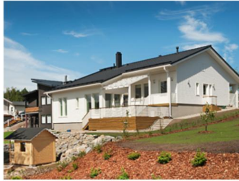
Kohde 4: Painikuja 4, Casa Arco, Finndomo Oy, 146 m 2 ja 170 m 2